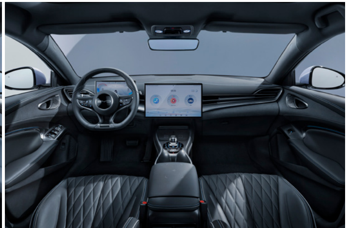
Læder i sort