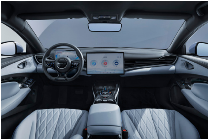
Læder i lyseblå (Tahitian Blue)