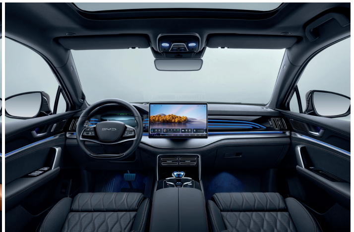
Nappalæder i sort