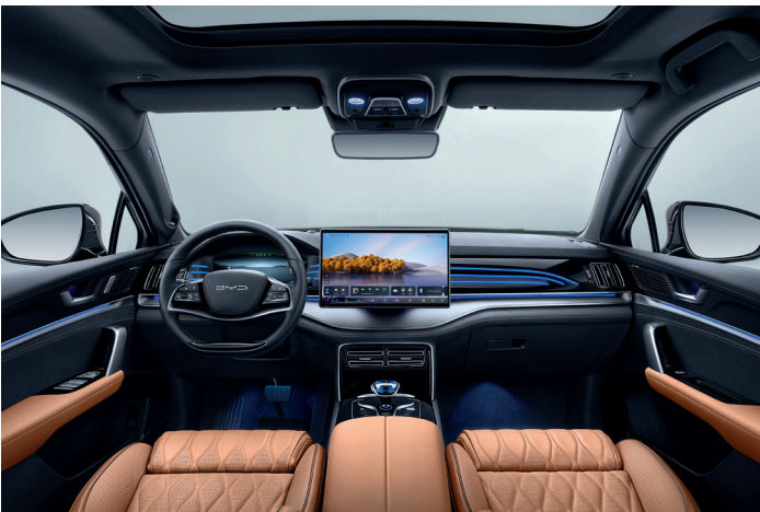
Nappalæder i brun